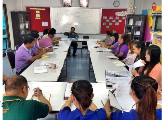
(๓.) การจัดความรู้ให้เป็นระบบ