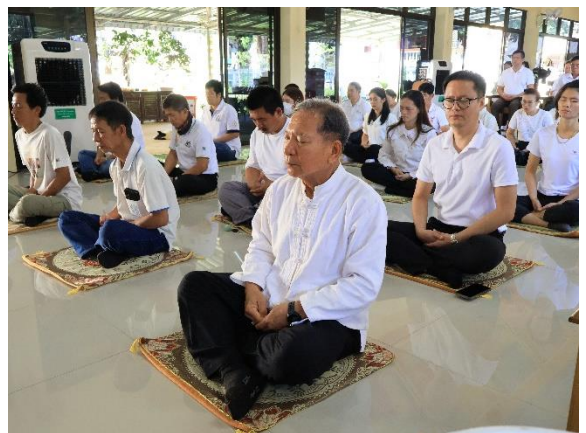
การบรรยายธรรม ในหัวข้อ คุณธรรม จริยธรรม สำหรับองค์กร และการฝึกการบริหารจิต และการนั่งสมาธิ โดย พระครูสมุห์หอมตะ ชิตธมโม (พระวิปัสสนาจารย์วัดแม่เตาดิน)