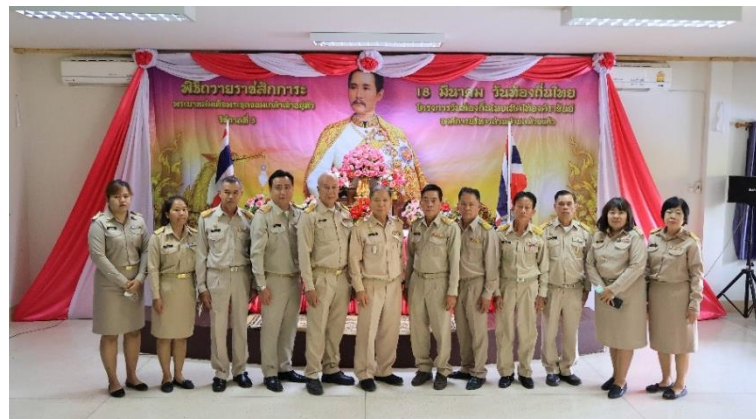
รายงานผลการดำเนินงานตามแผนบริหารและพัฒนาทรัพยากรบุคคล ประจำปีงบประมาณ พ.ศ. ๒๕๖๘