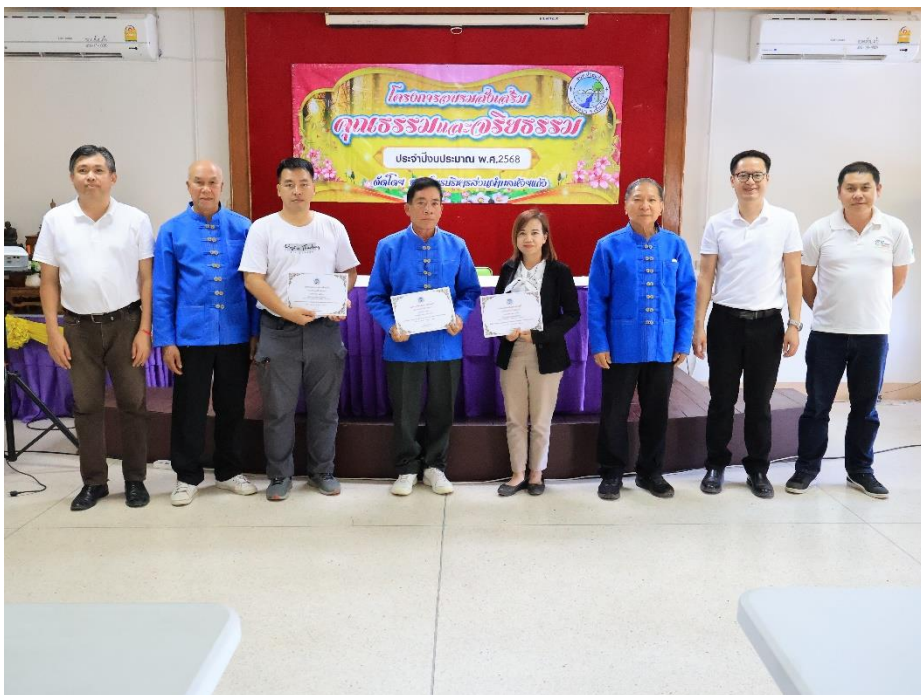
มอบเกียรติบัตร พนักงานที่มีคุณธรรม จริยธรรม และประพฤติตนเป็นที่ประจักษ์