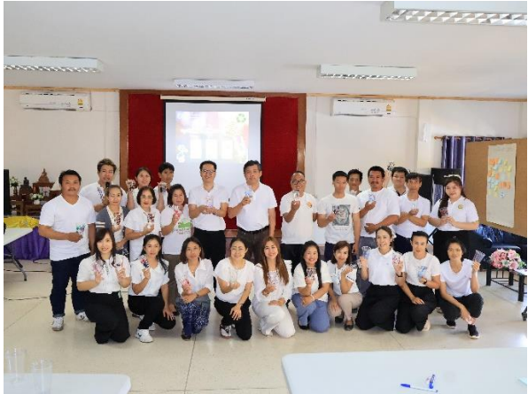
กิจกรรมองค์กรสัมพันธ์